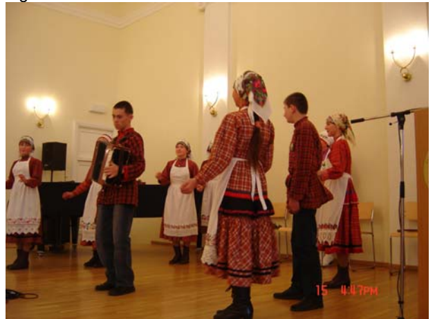
Lõuna-udmurdi ansambel "Baitereg" Hõimupäevade lõppkontserdil Inglise Kolledžis.

Nagu juba traditsiooniks on saanud, saabus Eestisse erinevate soome-ugri rahvaste folklooriansambleid, esindatud olid ungarlased, marid, mordvalased ja udmurdid. Ansamblid esinesid kontsertitega Harjumaal, Järvamaal, Lääne-Virumaal, Raplamaal, Põlvamaal, Valgamaal, Viljandimaal, Võrumaal. Meeleolukas ja huvilisi pungil oli tänava Tartu Ülikooli aulas toimunud lõppkontsert. Tallinnas, esmakordselt Inglise Kolledžis toimunud lõppkontsert pakkus sedapuhku tagasihoidlikumat huvi.