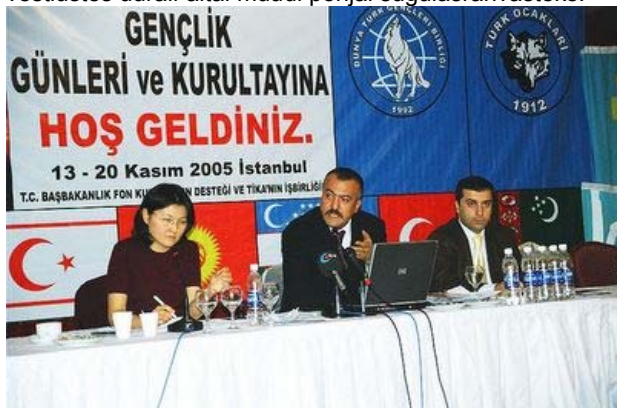
Turgi noorte kurultai.

Kurultai toimus 13.–20. novembrini Istanbulis Türgis. Avamisel oli Türgi välisminister Abdullah Gul. Seekord oli SURNA ametliku delegatsiooni staatusega. Eelmisel aastal kutsuti Rumeeniasse vaid kaks vaatleja staatusega SURNA esindajat. Meid, soomeugrilasi peeti vähemalt vestlustes uurali-altai müüdi põhjal sugulasrahvasteks.