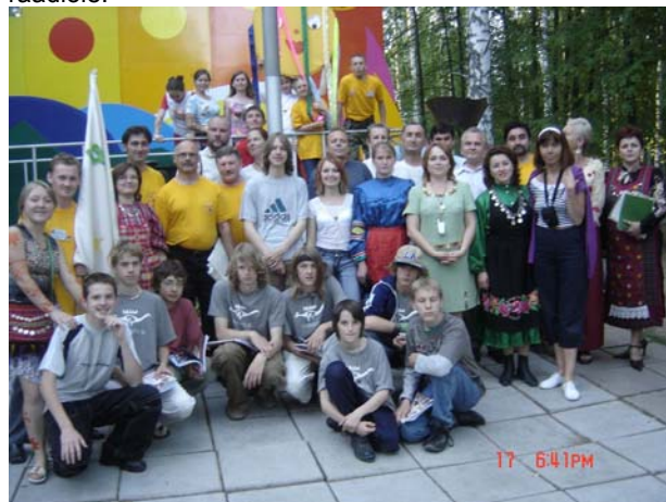
Eestlased ja udmurdid lastelaagris "Šundõkar"

Meie viibimine laagris tekitas elevuse kohalikus meedias. Andsime laagris kohapeal intervjuu "Televidenije Rossijale", Udmurdi TV laste- ja noortesaadete toimetusele ning veel neljale raadiojaamale, sh ka vene raadiole.