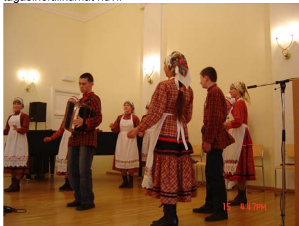
Lõuna-udmurdi ansambel "Baitereg" Hõimupäevade lõppkontserdil Inglise Kolledžis.

Nagu juba traditsiooniks on saanud, saabus Eestisse erinevate soome-ugri rahvaste folklooriansambleid, esindatud olid ungarlased, marid, mordvalased ja udmurdid. Ansamblid esinesid kontsertitega Harjumaal, Järvamaal, Lääne-Virumaal, Raplamaal, Põlvamaal, Valgamaal, Viljandimaal, Võrumaal. Meeleolukas ja huvilisi pungil oli tänava Tartu Ülikooli aulast toimunud lõppkontsert. Tallinnas, esmakordselt Inglise Kolledžis toimunud lõppkontsert pakkus sedapuhku tagasihoidlikumat huvi.